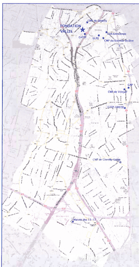
La Fondation Vallée sur le secteur 94106